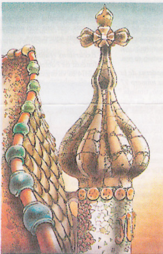
CASA BATLLÓ. 1904-1906 - BARCELONA

No dubteu demanar-nos aclariment sobre les activitats que organitzem.